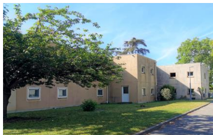
Foyer Hébergement "Les Oliviers" Bat 21