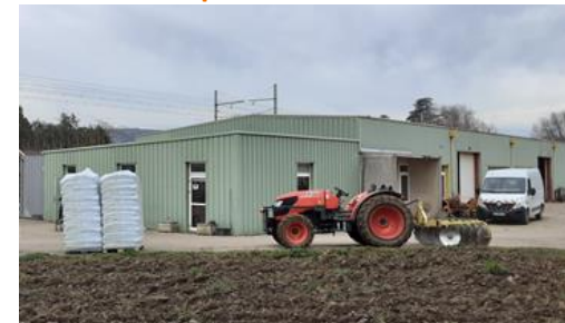
Ateliers Espaces Verts et BIO Bât 19