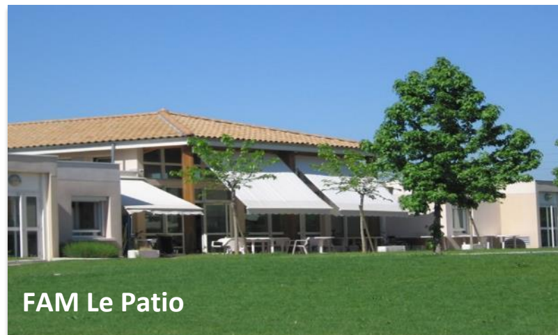
FAM Le Patio

FINES 260 000 161 - SIREN 779 456 367 - APE 861 02