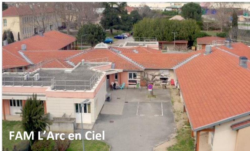
FAM L'Arc en Ciel